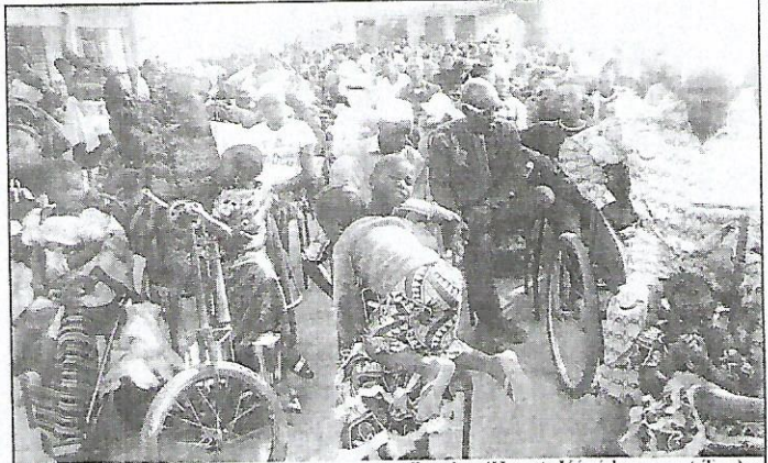
Ils sont venus des 3 provinces des Hauts-Bassins (Houet, Kénédougou et Tuy) pour communier à l'occasion de la journée qui leur est dédiée

Cette 24 ème Journée internationale des personnes handicapées (JIPH) est placée sous le thème « Transformation durable pour une société inclusive », par la communauté internationale. Dans la région des Hauts-Bassins au Burkina Faso, la CORAH/HB a retenu le sous-thème : « Autonomisation économique des personnes handicapées : rôle des acteurs publics et privés de la région des Hauts-Bassins pour une participation pleine et effective des personnes handicapées au développement socio-économique du Burkina Faso ». Il a fait l'objet d'échanges. Ce qui a permis aux personnes handicapées d'égrainer leurs préoccupations, mais aussi