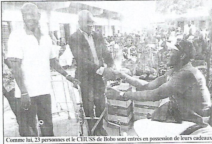
Comme lui, 23 personnes et le CHUSS de Bobo sont entrés en possession de leurs cadeaux

Célébrée chaque 3 décembre, la Journée internationale des personnes handicapées a été commémorée en différé, samedi 16 décembre 2017 par la Coordination régionale des personnes handicapées des Hauts-Bassins (CORAH/HB). C'est le Centre de formation des personnes handicapées de Bobo-Dioulasso qui a abrité les activités.